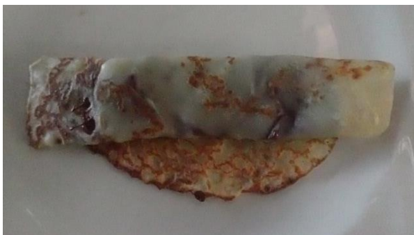
Crêpe au Nutella