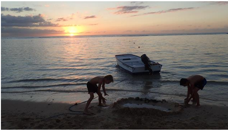
Activité château de sable