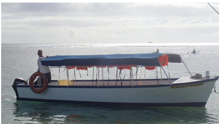
Bateau fond transparent pour voir les poissons et les fonds marins