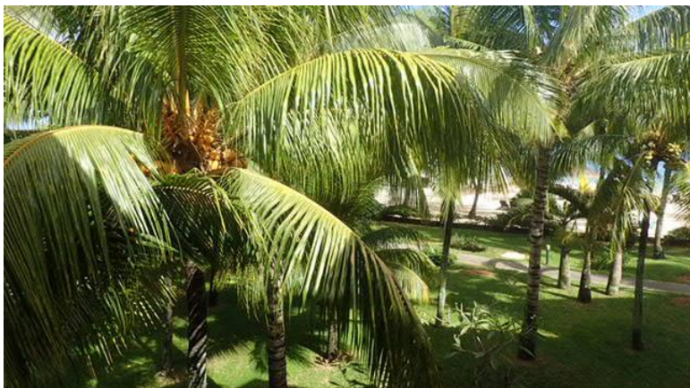
Vue de notre chambre