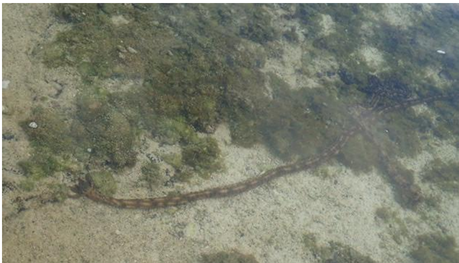
Drôles de bêtes sous l'eau