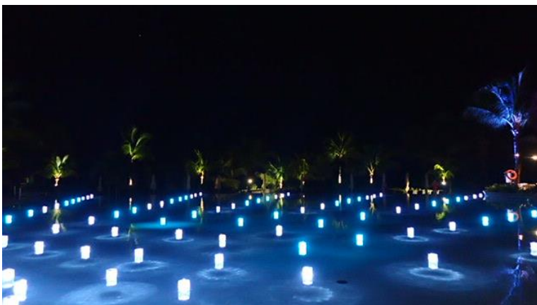
Lumières sur la piscine