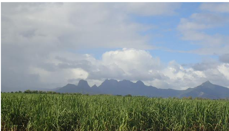
Champs de canne à sucre et monts près de l'hôtel