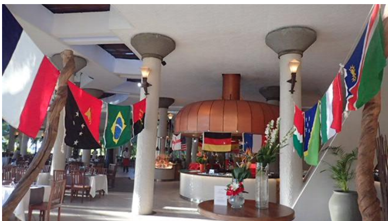
Repas saveurs du monde