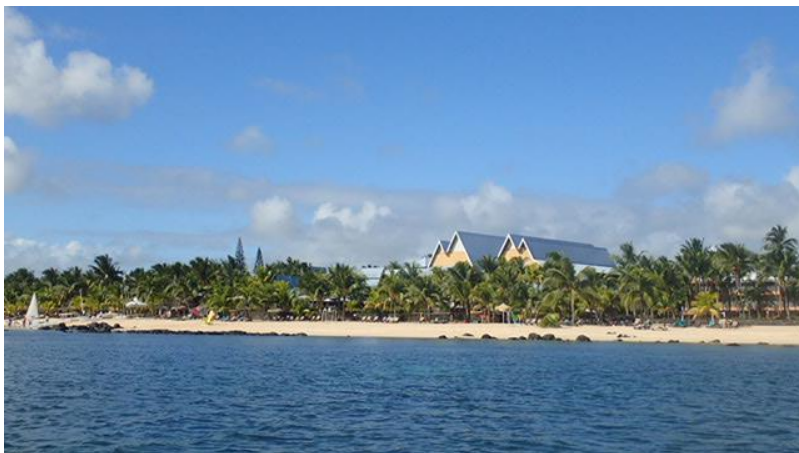
Hôtel vu de la mer