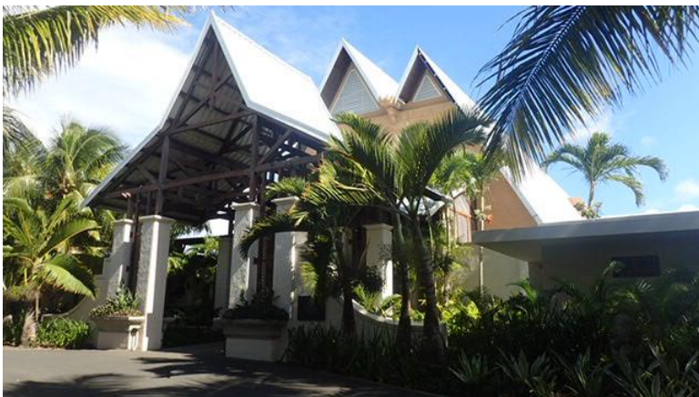
Entrée de l'hôtel