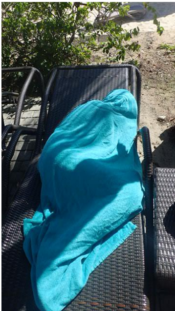
Allan bronze !